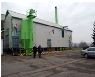
Nem látszik a füst!