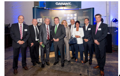
„Ez a jövő!” – Herr Untersteller, Miniszter,