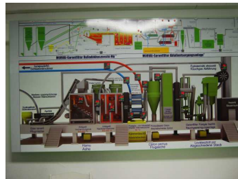
A reteszfeltételek biztosítottak!